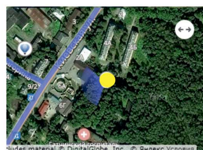
Вид с высоты птичьего полета (видовая точка на границе Приоратского парка вблизи пересечения улиц Григорина и Киевской)