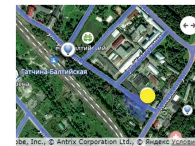
Вид с высоты птичьего полета (видовая точка над площадью Коннетабль)