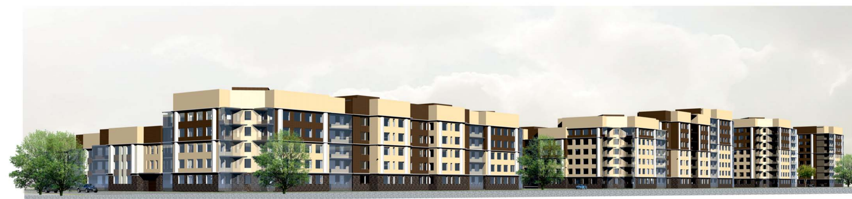
Застройка. Перспективный вид со стороны бульвара Авиаторов