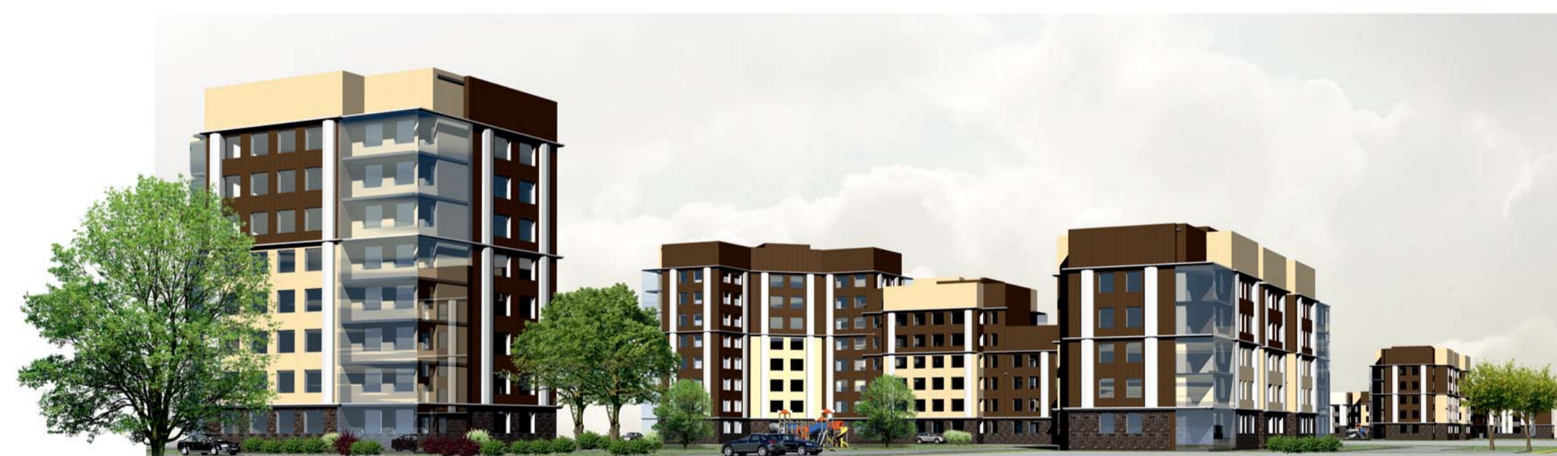
Застройка. Перспективный вид со стороны въезда с Киевской улицы